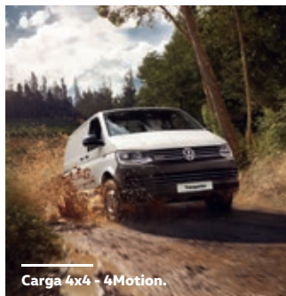
Carga 4x4 - 4Motion.